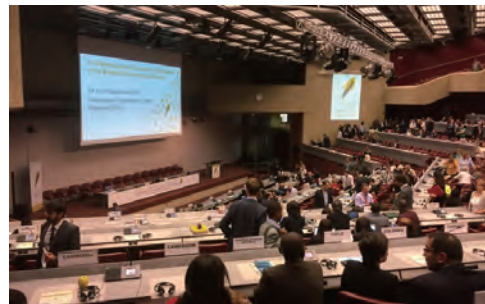
COP1会場の様子(スイス・ジュネーブ)

を評価するためのデータ提供を目的とする「世界モニタリング計画」を策定することとされており、同計画への協力・支援を行う業務を環境省から受託しています。その一環として、毛髪中の水銀を分析するデモンストレーションをCOP1において行いました。また、途上国において水銀のモニタリングを的確に行うことが必要とされていることから、環境省業務として、途上国の実務担当者を招聘し当社の環境創造研究所(静岡県焼津市)などで水銀の分析等に関する研修を行っています。さらに、国際協力機構(JICA)からも「多媒体水銀モニタリング能力向上」という業務を受託し、大気中の水銀調査や生体試料(毛髪)など多媒体の水銀モニタリングの研修を行っています。当社はこれらの業務や培ってきた水銀測定・分析技術を通じて、今後とも「マーキュリー・ミニマム」の環境の実現に貢献してまいります。