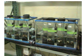
二枚貝代謝速度実験